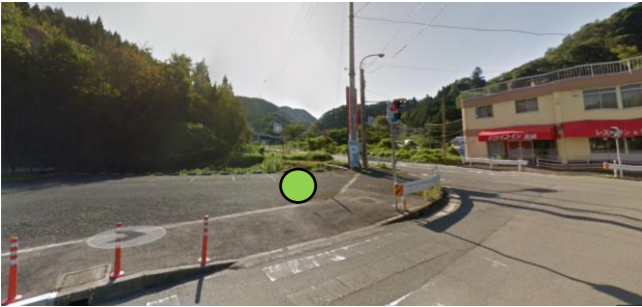
51_ドライブイン東城