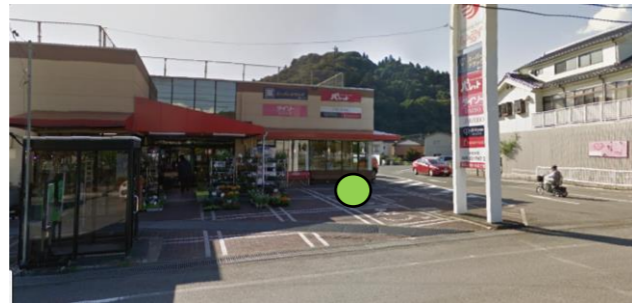
56_トーエイ(待合室前)