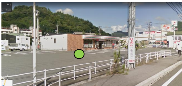
55_セブンイレブン東城川東店