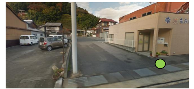
63_三上クリニック前